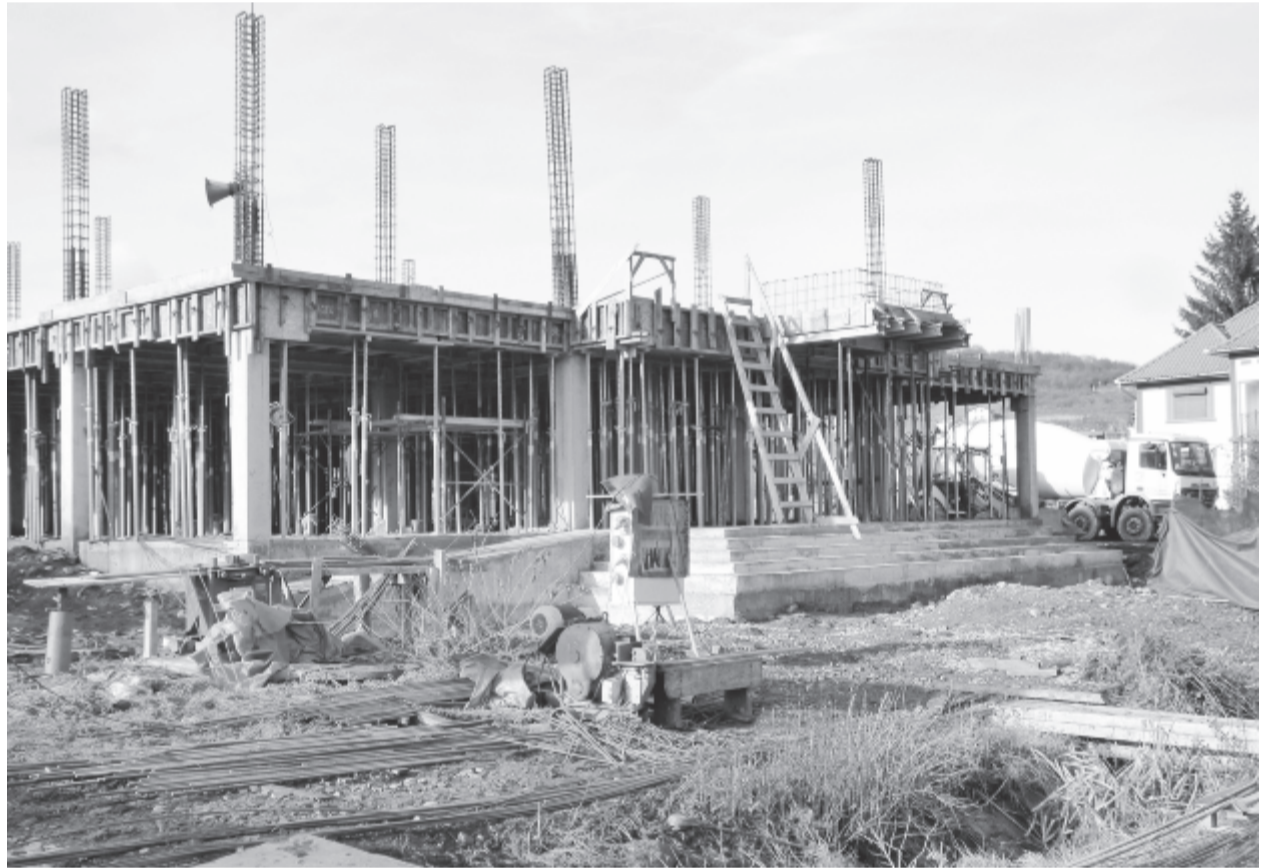
Számos kisebb-nagyobb megvalósítás és terv van terítéken – egyebek mellett az óvodaépítés is

A fejlesztések eredményeként pozitív megítélésű a fürdőtelep és a város arculata, tavaly elnyerték az ország legösszetettebb fürdőtelepülése címet, és a Medve-tó bekerült a rekordok könyvébe. Használatba adták a Kusztos Endre-emlékház földszinti részét, és kiadták a Képek Szovátáról című településmonográfiát is – sorolta az eredményeket a fürdőváros vezetője. (gligor)