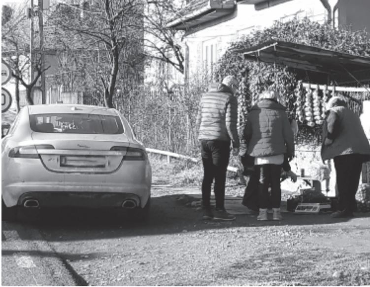
Télen is megéri a kibédieknek a kapuban álldogálni