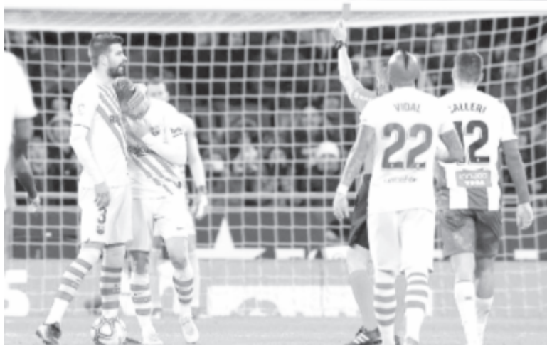
De Jongot kiállította a játékvezetőt az Espanyol – Barcelona (2-2) helyi rangadó 75. percében. A vendégek edzője, Ernesto Valverde szerint ennek döntő jelentősége volt abban, hogy a házigazdák végül döntetlenre mentették a meccset.

* Francia Ligue 1, 19. forduló: AS Monaco – Lille 5-1, Dijon – Metz 2-2, Nantes – Angers 1-2, Montpellier HSC – Brest 4-0, Nice – Toulouse 3-0, Olympique Marseille – Nimes 3-1, Paris St. Germain – Amiens SC 4-1, Strasbourg – St. Etienne 2-1, Reims – Lyon 1-1, Stade Rennes – Bordeaux 1-0. Az élcsoport: 1. Paris St. Germain 45 pont, 2. Olympique Marseille 38, 3. Stade Rennes 33.