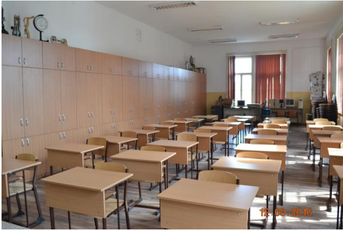
Laborator de fizică