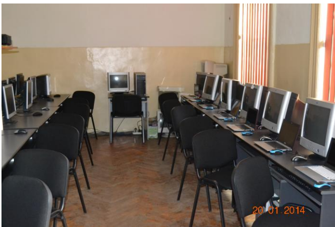
Cabinet de informatică