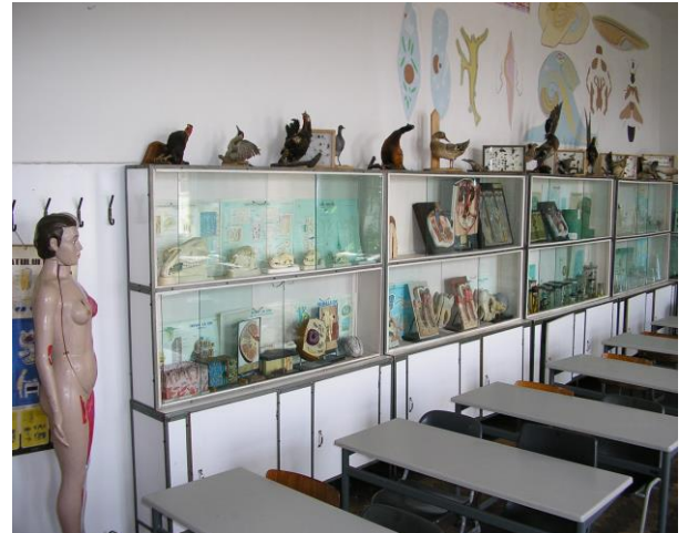
Laborator de biologie