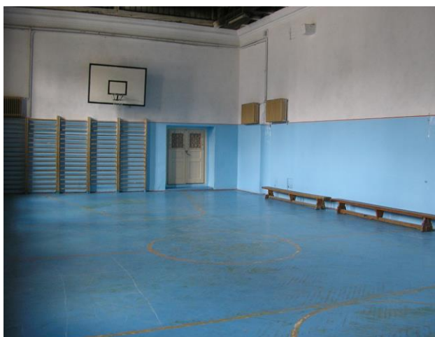
Sală de sport